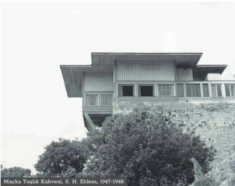
Maçka Taşlık Kahvesi, S. H. Eldem, 1947-1948

Eğer zamanı evrimsel bir süreklilik içinde bir akış olarak kavırıyorsanız, Türk Evi, zamanın doğal akışına uygun, süreklilik içinde değişmesi gereken bir tasarım olarak yorumlanır ve günümüze uyarlanır. Burada süreklilik modelini eş zamanlılık modelinden ayıran özellik, mekânsal ve biçimsel olarak Türk Evinin kopyalanmadan