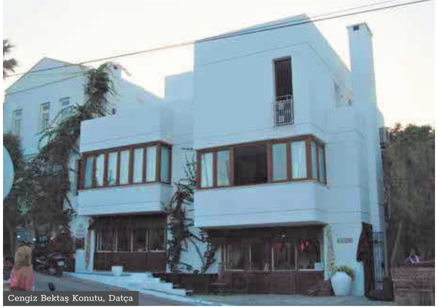
Cengiz Bektaş Konutu, Datça

Ancak zaman, kesintili süreklilik olarak kavranırsa bu defa Türk Evi biçimsel bir tanımla değil, tasarımı oluşturan "özler" toplamından yeni bir mimarlık dilini yaratmayı hedefler. Türk Evi bir alt metin olarak okunur. Gümüş Su Villalarının tasarımında ilk bakışta "Türk Evi" ile biçimsel bağlamda bir tanıdıklık ilişkisi kurulmayabilir. Ancak Türk Evinin zamansal süreci içinde erken oluşumlarında, ön sofa bir mekânsal biçimlenişe rastlanır. Bu tasarım biçimsel dil olarak Türk Evine dolaysız bir referans vermese de bir alt metin olarak okunmaktadır.